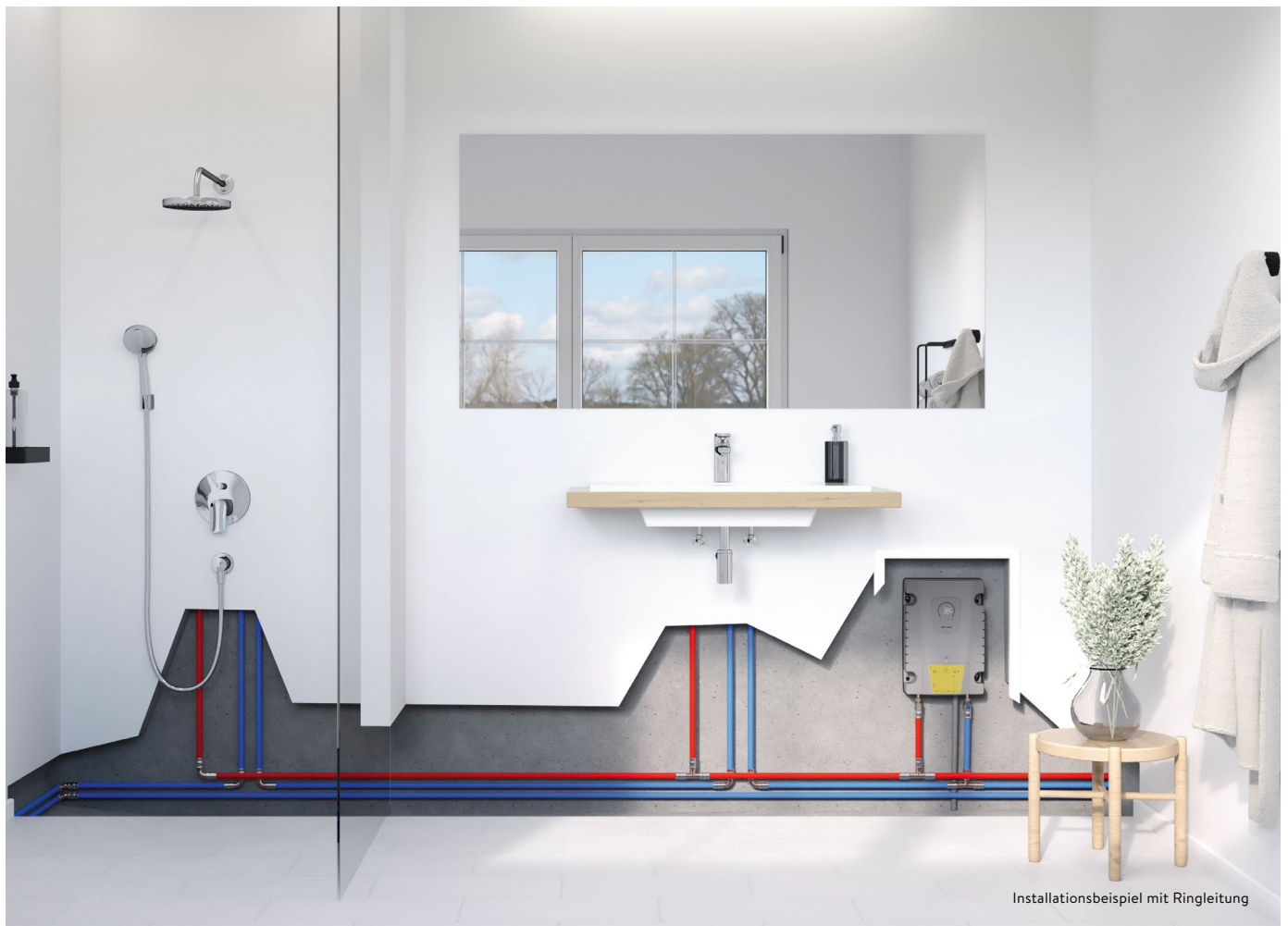
Installationsbeispiel mit Ringleitung